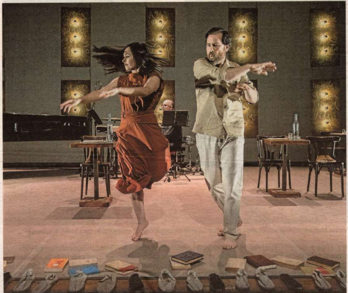
El montaje escénico funde poesía y música. AZ

La gira de la compañía se detiene hoy en el Centro Cívico de Cazoña y mañana en el Teatro de Ribamontán al Mar