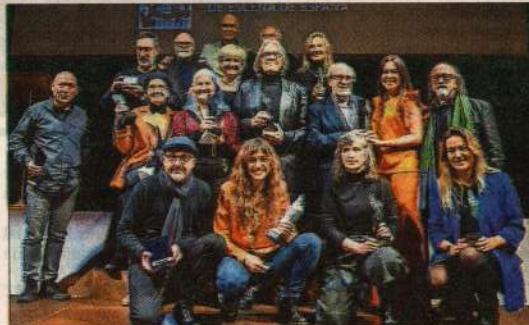
Foto de familia de los galardonados.

Por otra parte, es una dinamizadora de la actividad escénica en su comunidad, Cantabria, habiéndose ocupado de la producción y gestión de programas como 'Mar Sessions' y 'Show Hall' y encabezando proyectos tan significativos como 'Menuda Escena' y 'La palabra habitada: El autor y sus voces', además de la estrecha vinculación con la Muestra Internacional de Teatro Contemporáneo (32 ediciones) de la Universidad de Cantabria. Otros años han sido merecedores de este premio nombres relevantes de la escena como José Sanchis Sinistera, Red de Teatros Alternativos,