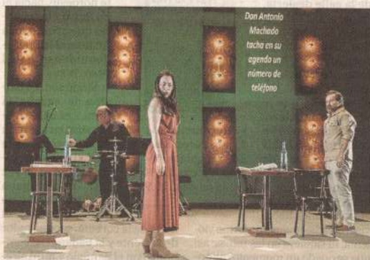
Escena del montaje 'Yo, José Hierro'. az

'Yo, José Hierro' es un proyecto en donde se funden poesía y música en un espectáculo escénico creado sobre la interpreta-