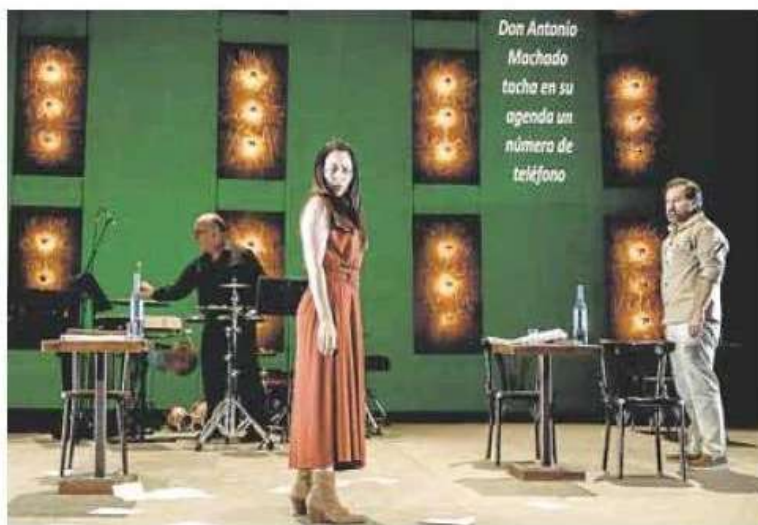
Escena del montaje 'Yo, José Hierro'. AZ

'Yo, José Hierro' es un proyecto en donde se funden poesía y música en un espectáculo escénico creado sobre la interpreta-