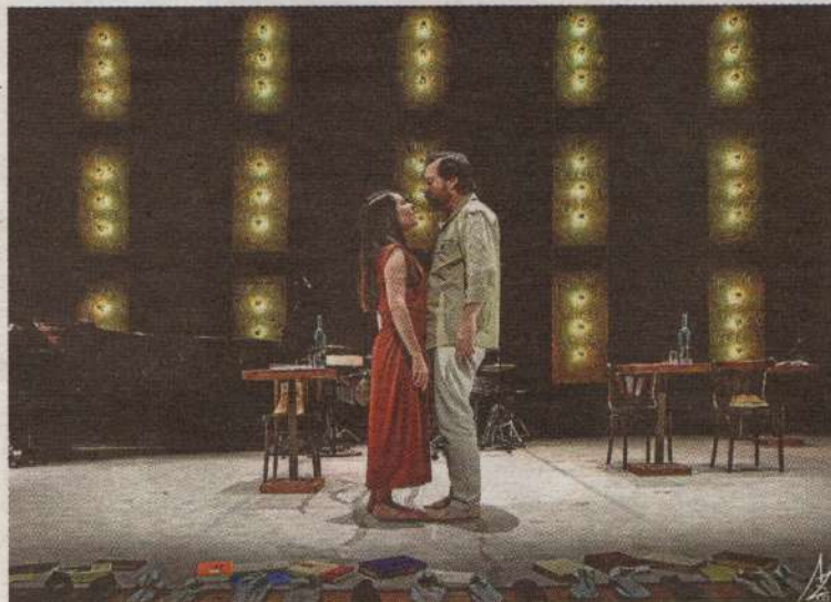
Imagen de la representación de la obra. ÁUREO GÓMEZ

SANTANDER. El veterano colectivo teatral La Machina subraya que resulta ocioso descubrir la figura de José Hierro, pero «no es un ejercicio inútil insistir en su relevancia artística, en la gran calidad humana que le caracterizó y en la singularidad poética de su obra». Tampoco es preciso dejar constancia del carisma personal que tenía, ni de lo emblemático que supuso -y supone- su nombre, no sólo en el ámbito de la poesía, sino en todo el panorama cultural nacional». No ha sido ajeno al trabajo de La Machina Teatro la apropiación de materiales poéticos que sirvieron de base, inspiración