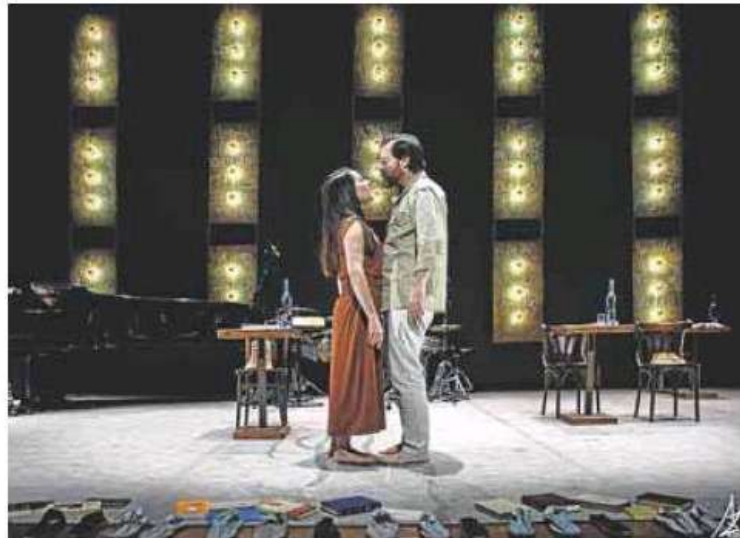
Imagen de la representación de la obra.

SANTANDER. El veterano colectivo teatral La Machina subraya que resulta ocioso descubrir la figura de José Hierro, pero «no es un ejercicio inútil insistir en su relevancia artística, en la gran calidad humana que le caracterizó y en la singularidad poética de su obra». Tampoco es preciso dejar constancia del carisma personal que tenía, ni de lo emblemático que supuso -y supone- su nombre, no sólo en el ámbito de la poesía, sino en todo el panorama cultural nacional». No ha sido ajeno al trabajo de La Machina Teatro la apropiación de materiales poéticos que sirvieron de base, inspiración