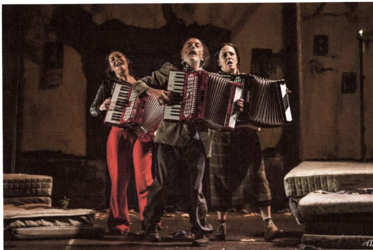
La Machina Teatro pone en escena "Casquería Fina".

La compañía Tela Marinera ofreció una representación gratuita y el viernes 31 tendrá lugar otra a cargo de La Machina