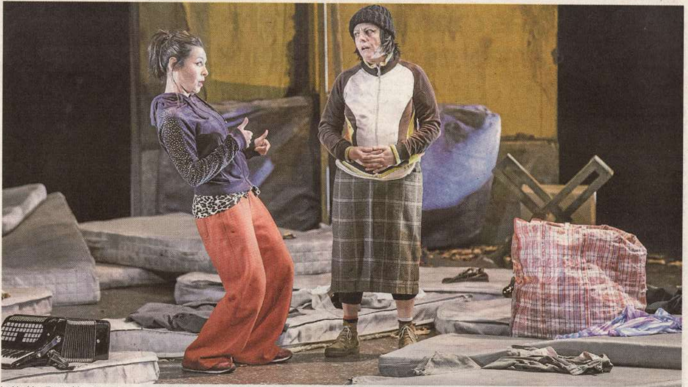
La Machina Teatro hizo ayer un pase especial de 'Casquería fina' para escolares, una obra sobre la explotación y los perdedores.