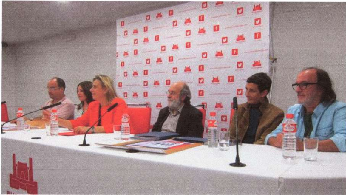
La Machina estrena el sábado 'Casquería fina', última obra de Isaac Cuende SANTANDER | EUROPA PRESS

La Machina Teatro estrenará el sábado 29 en el Palacio de Festivales la última obra del dramaturgo santanderino recientemente fallecido Isaac Cuende, 'Casquería fina', que es una continuación de 'La sucursal' once años después.