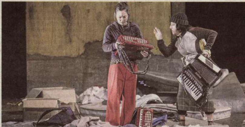
Imagen de un ensayo de 'Casquería fina' de La Machina Teatro.

El teatro es, junto con el cine, una de las actividades que más interés y respuesta despiertan en el público, como demuestran el ciclo actual sobre el melodrama y las representaciones de 'Novecento, la leyenda del