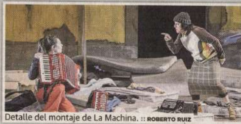
Detalle del montaje de La Machina.

El esfuerzo y entusiasmo de los actores de La Machina es clave para sacar adelante un trabajo difícil